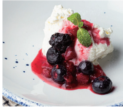
レアチーズケーキ 680 Rare Cheesecake