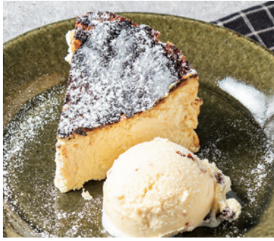
バスクチーズケーキ 880 Basque Burnt Cheesecake