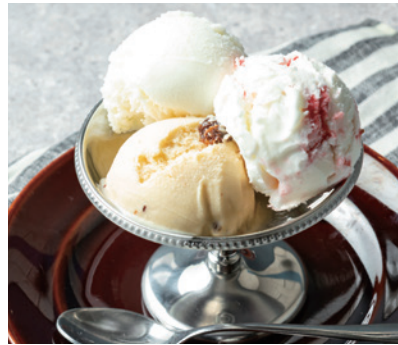
ジェラテリアFIOREの ジェラート盛り合わせ 680 Gelato Platter