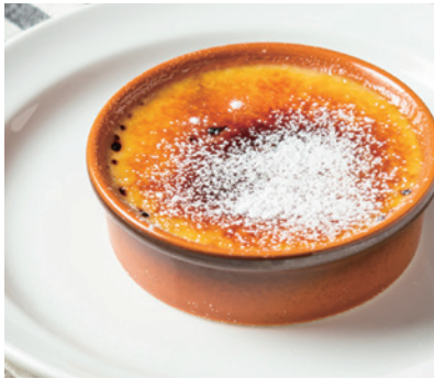
クレームブリュレ 680 Creme brulee