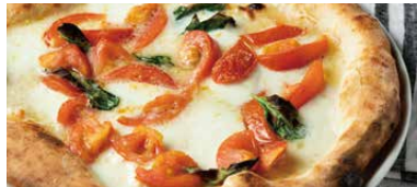
水牛モッツアレラチーズ マルゲリータ 1800 Margherita Bufala