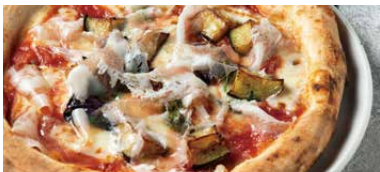
茄子とグアンチャーレ メランツァーネ 1500 Melanzane