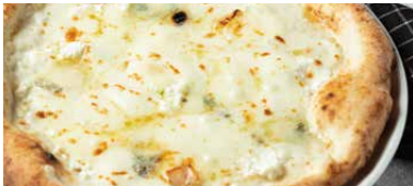
4種チーズ クアトロフォルマッジオ アカシアのはちみつ添え Quattro Formaggi 1600