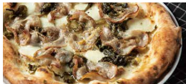
優味豚とイタリアンブロッコリー ポルケッタフリリエリ 1500 Porchetta & Friarielli