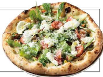
たっぷり季節野菜と 水牛モッツアレラチーズ PIZZA423 1800 Seasonal Vegetable