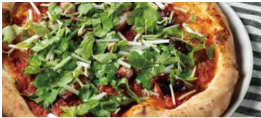
淡路ダコとホワイトセロリ マリナーラ 1350 Octopus Marinara