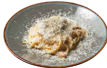
イタリア産パンチェッタと もみじ卵の濃厚カルボナーラ 1500 Carbonara