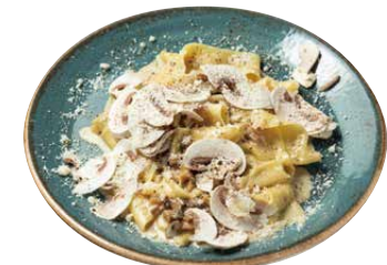
ポルチーニ茸とマッシュルームの クリームソース トリュフ風味のパッケリ 1600 Porcini & Mushroom Cream Sauce