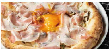
4種のキノコとイタリア産ハム ビスマルクビアンカ 1600 Bismarck Bianca