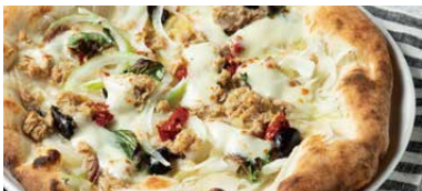
淡路玉ねぎとレモン PIZZAリモーネ 1450 Onion & Lemon