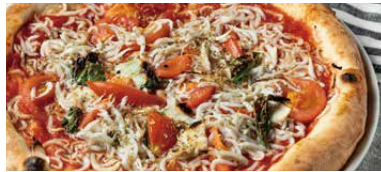
淡路島産のたっぷりシラスと 七味唐辛子 チチニエリ 1500 Chicinielli