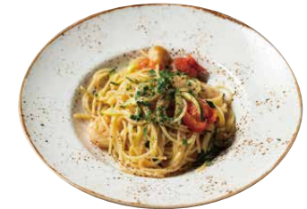
海老とズッキーニと フレッシュトマトのオイルソース 1300 Shrimp, Zucchini & Fresh Tomato