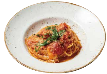
モッツアレラチーズと 淡路島産トマトと バジリコのポモドーロ(スパゲティ) 1380 Pomodoro