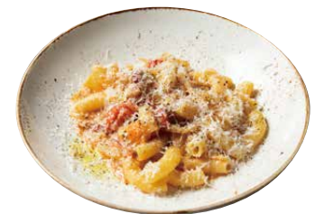
淡路玉ねぎとイタリア産ハムの アマトリチャーナ(リガトニ) 1380 Amatriciana