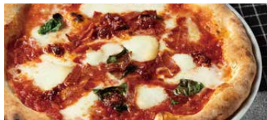
イタリア産サラミと生ソーセージ カラブレーゼ 1700 Calabrese